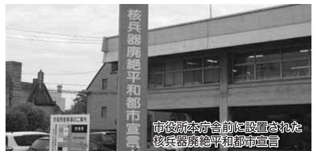
市役所本庁舎前に設置された 核兵器廃絶平和都市宣言

であるから、国民生活を脅かすものであってはならない。率直に言って地震国である日本においての原子力発電は、安全性について理論的には確立されているとしても、「実際に様々な事態が起きたときに確に対処し、安全を確保することが出来る」という技術力、対応力に危うさを感じている。国として暫定的な安全判断基準ではなく、早く新体制を発足させて国民も納得ができる安全規制、安全基準を制定すべきである。