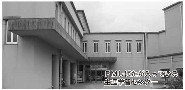
FMしばたが入っている生涯学習センター

Q FMしばたに関する新発田市の方針について A 一刻も早い難聴地域の解消が市の責務である