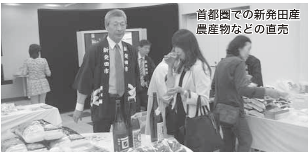
首都圏での新発田産農産物などの直売

問い 地域農業マスタープランについては、いまだはつきりしていない。後日、認定基準が定まった折には、条件が達成されている離農農家については、4月までさかのぼって認定していただきたい。