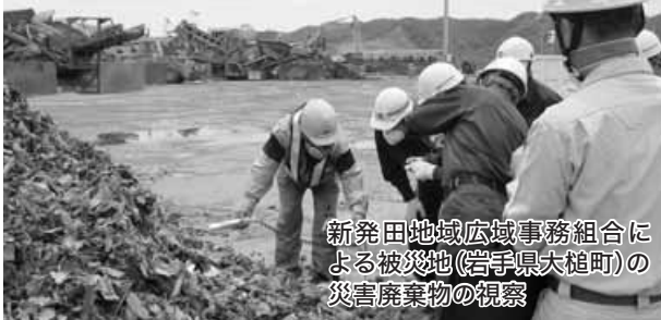
新発田地域広域事務組合による被災地(岩手県大槌町)の災害廃棄物の視察

問 災害廃棄物処理が進まない障害は、政府が放射性物質への対策を真剣に行っていないことだ。セシウムの濃度8000 Bq(ベクレル)/kg以下は放射性物質が含まれていても一般廃棄物の扱いで、まともな対策が講じられていない。焼却での放射性物質の拡散、処分場周辺の放射線量、雨水や地下水での漏れなどの心配や不安が出されている。①受入災害廃棄物は放射