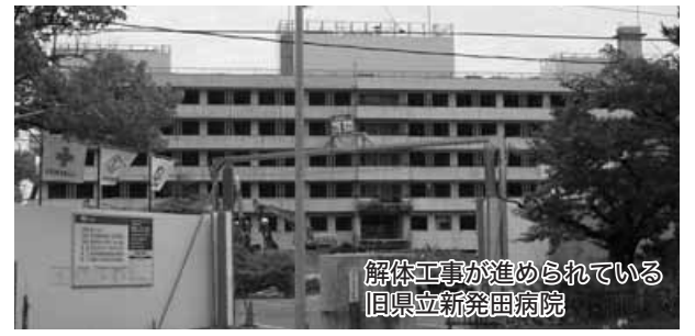
解体工事が進められている旧県立新発田病院

「つき姫復興バスプラン」を企画・実施した。約4億2700万円もの経済波及効果があった。④平成22年に県立新発田病院跡地活用整備計画を策定した。計画の施設整備を進めることで、歴史のみちは、寺町通りの街並み、清水園や足軽長屋等から、病院跡地、お城、自衛隊広報館、西公園、西ヶ輪、四之町、新発田川の水のみちへと新たな連続性をもった、江戸期、明治期、大正期、昭和期と歴史的遺産を活用し、「歴史と観光」を兼ね合わせた、まちなかの回遊性と連続づくりによる、観光の振興に大いに活用できるものと考ええる。