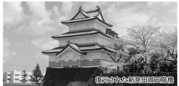
復元された新発田城三階櫓

Q 新発田城三階櫓の開放について A 復元の記念日等、折にふれ見学ができるよう自衛隊と継続的に協議したい 問 新発田城の三階櫓は、自衛隊新発田駐屯地内にあり、原則的には立入禁止となっており、市民の見学は限られている。もう少し多くの市民が見学することはできないのか。近くに白壁兵舎が完成するが、三階櫓との観光面の活用についての考えは。 答 三階櫓が復元された区域は、自衛隊の弾薬庫に隣接しており、立入禁止区域として、市と陸上自衛隊間で協定を結んでいる。 現状では見学の機会を増やすことは難しく、復元の記念日等、折にふれ見学ができるよう、今後とも継続的に自衛隊と協議したい。白壁兵舎の古材を利用した広報館と三階櫓の観光面での活用については、「歴史のみちゾーン」「水のみちゾーン」「センタリングゾーン」の各整備を促進し、住む人はもちろん、訪れる人を引きつけるまちの魅力と品格を高め、ひいては観光振興に結びつけていきたい。