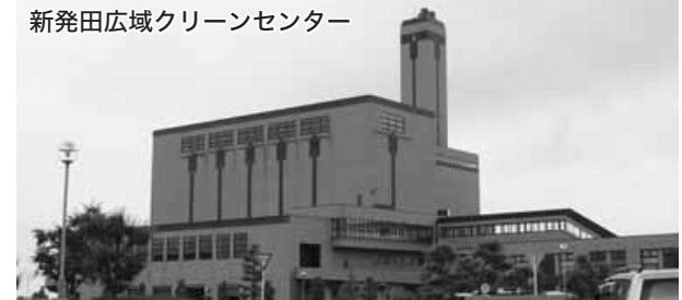
新発田広域クリーンセンター

により、空き家が年々増加傾向にあるのも事実である。他県では既に条例を制定しているところもあり、県内でも、見附市が6月定例会に条例を提案すると聞いていた。当市においても、先進事例を参考としながら条例制定に向け準備を進めており、今後、庁内関係課や関係団体などから構成する検討委員会を設置し、12月定例会を目前に検討を進めていきたい。