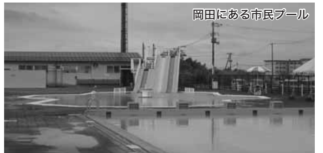
岡田にある市民プール

Q 防災・減災対策に公共施設や橋梁等の老朽化対策は A 公共施設の耐震改修を進め、橋梁長寿命化修繕計画を策定し、橋梁の修繕に取り組みたい