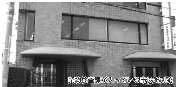
契約検査課が入っている市役所別館

市が発注する建設工事については、当市の発注公募ランクに基づき、工事ごとに登録業種やランクの要件を設定している。参加要件の審査にお