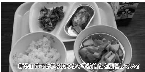
新発田市では約9000食の学校給食を調理している

答 え 金属片の混入原因については、調理場設備、器具等の確認、従事職員への聞き取り、調理場への保健所の立ち入り調査、納入業者への調査等を行ったが混入原因を特定することができなかった。改めて調理工程、配食過程を保健所の指導も受けながら再点検し、調理場の設備器具等施設全体を再確認して、納入業者にも再調査を指示した。再発防止に向けては、調理場職員に改めて注意喚起をしたことはもちろん、調理工程におけるより細かな仕分けでの目視確認、設備器具類の点検方法の改善強化など、すぐ