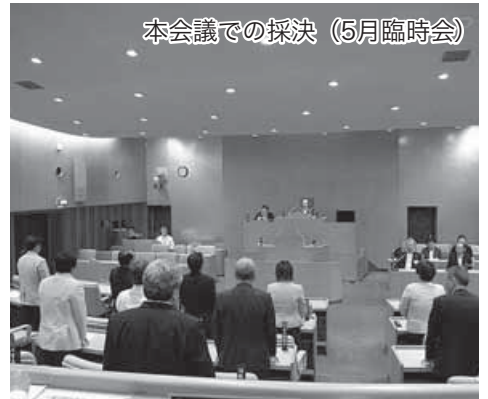
本会議での採決 (5月臨時会)