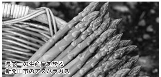
県内一の生産量を誇る新発田市のアスパラガス

また、6次産業化にあたっては農業者自らの意識改革も必要と考えている。積極的な農業者には支援指導をし、農業者と行政がスクラムを組んで推進したい。