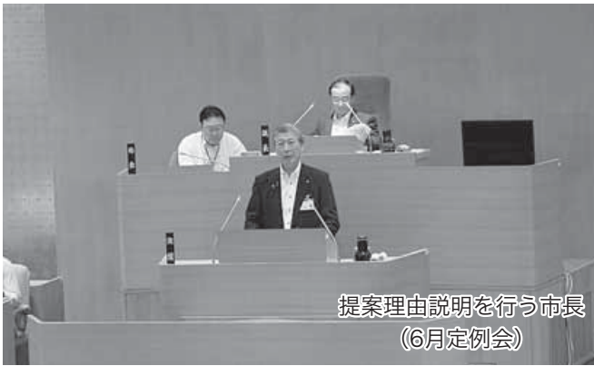
提案理由説明を行う市長 (6月定例会)