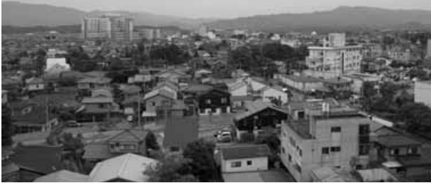
市役所から見た中心市街地

問 ①再構築のための庁内プロジェクトチームの活動内容、特に市民参画のあり方についてどう考えているのか。②今までよく見られた各部署、各課の事業の寄せ集め的な再構築になるおそれはないのか。それを防ぐため、プロジェクトチームではなく、「中心市街地活性化課」をつくってはどうか。③中心地については市民の興味関心も薄れつつあり、衰退は歴史的必要かつめない。これを打破