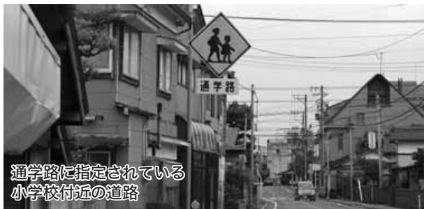
通学路に指定されている 小学校付近の道路

答 ①今年5月現在で、65歳以上の高齢者が50%以上を占める自治会は5つである。国勢調査の推移でも高齢化が進んでいる。②組織を横断した、地域の実情に合う総合的な地域支援に取り組む、自治会連合会の地区組織立ち上げに合わせ、地域協働の実践を進めていきたい。③助成事業の必要性については、行政指導の一過性の取組みではなく、自ら地域課題に取り組もうとする「地域のやる気」に対して行われるものであり、地域の実情に合った支援でなければならぬ。