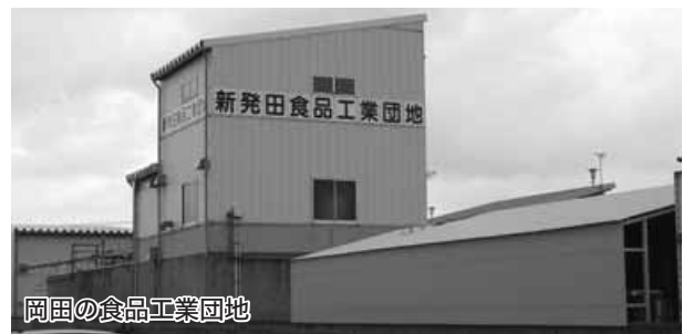
岡田の食品工業団地

川地域・箱岩地区の日本海東北自動車道土採り場跡地である。両候補地においては、環境面をはじめ優位面を全面的に打ち出し、合わせて「優遇策」を付け加えての「企業誘致活動」を行っていききたい。 ④食品工業団地においては、食品関連企業に特化した誘致を行い、ほかの場所への誘致については、税収の確保と雇用の創出を最優先とし、あえて誘致する企業を絞り込まず、幅広い業種を誘致していききたい。