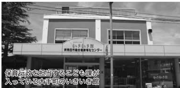
保育行政を担当するこども課が入っている大手町のいきいき館

答 ①6月1日現在、待機児童はゼロ歳児1名、1歳児2名。国は現行制度拡充を検討するが、待機児童などの課題が整理されると考える。②同法第24条の改正案によれば市町村は保育の必要をすべての子どもに必要な措置を講じなければならぬので、保育園の入園はこれまでどおり利用調整を行いたい。③株式会社等が参入する場合は、市独自の基準を定め対応したい。