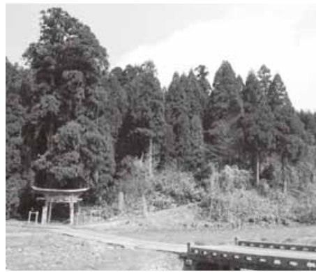
藤戸神社（東宮内地内）

答 ①藤戸町と交流があると聞いているが、都市間交流の締結は民間交流が深まり一定の素地が整った段階で考えていきたい。②歴史的価値が高く地区の大切な観光資源と考える。櫛形山脈を活用したツアーや菅谷寺、藤戸神社への参拝を組み込んだ企画を検討し、阿賀北8市町村との連携により、広域観光周遊ルートを整備し、首都圏や関西圏での商談会の場でPRしていきたい。③山城の絵図面等もなく、再建には多くの課題がある。遺構の保護・保存に努め、次世代へ引き継ぐことが先決であり、観光資源として利用や周知等について検討していきたい。