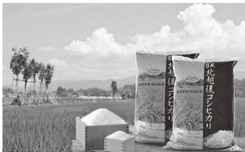
ふるさと納税返礼品のコシヒカリ

市としても、米の輸出拡大を推進していく。観光産業と結びつけた海外からの観光客をターゲットにした顔の見える取引、特に台湾を中心に市長としてトップセールスを積極的に行い、新発田で生産した美味しい米を大いに売り込んでいきたいと考えている。