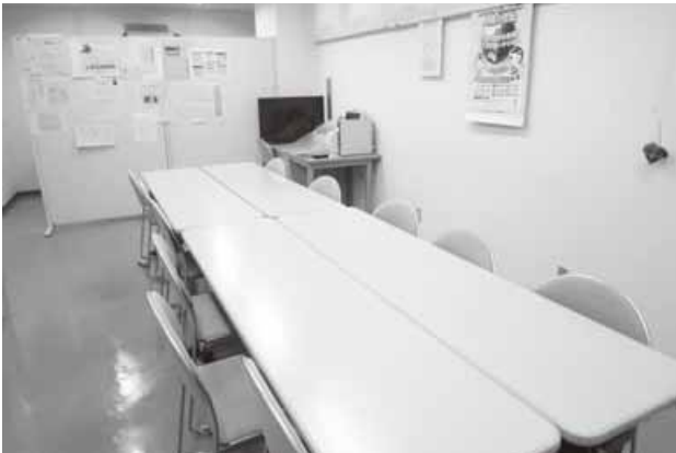
男女共同参画交流ルーム

問 現在の男女共同参画活動拠点施設は手狭で市民への周知度が低く、情報発信や啓発活動がしにくい場所