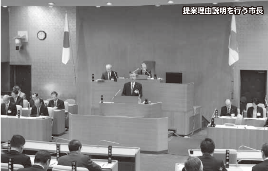
提案理由説明を行う市長

平成28年2月定例会は、2月25日から3月23日までの28日間を会期として開かれました。定例会では、平成28年度当初予算案や条例改正案、教育委員会委員の任命などの議案を審議しました。また、会派代表質問や一般質問で市長の政治姿勢などをたずねました。