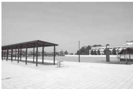
防災公園「アイネスしばた」

答 全国障害者スポーツ大会への出場者に対する激励金贈呈や社会教育認定団体に登録する福祉団体の活動や障害者スポーツ大会開催時における体育施設使用料の減免を行っている。体育施設における障がい者の個人利用の減免については、福祉関係団体や利用者から話を聞くなどして、利用実態とニーズを把握し最も有効な策を講じていきたい。