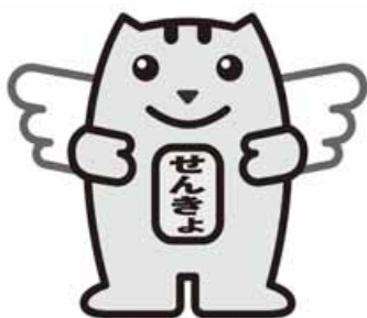
明るい選挙のイメージキャラクター「選挙のめいすいくん」