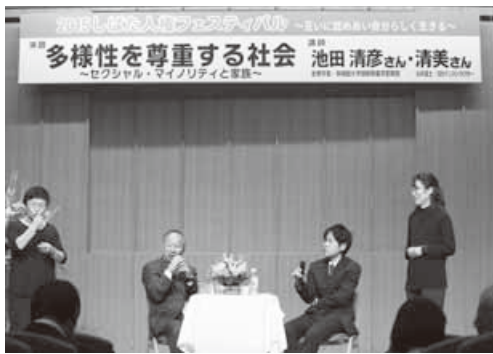
2015しばた人権フェスティバル

答 市では、男女共生市民講座や人権フェスティバルの開催や広報等による啓発を行うとともに、市民団体による啓発を行うとともに、市民団体による固定的な役割分担意識を払拭していくことが重要な課題である。男女共同参画の推進は行政だけでなく、協働しながら、施策推進や事業実施も重要な課題である。