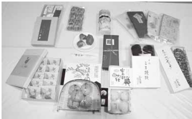
平成26年度ブランド認証商品

答 ブランド認証制度の効果を測るため、市では認証事業者から毎年度終了後に、前年度の認証商品の販売量の対前年度伸び率についての報告をお願いしている。報告によると平成26年度売上の前年対比は、認証商品20品中、15パーセント以上の売上増が6商品、10パーセント以上の売上増が3商品、5パーセント以上の売上増が8商品、変わらないという