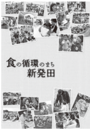
食の循環のまちPRパンフレット(表紙)

答 資金調達については、金利の動向や金融情勢に注視し、借入れ先の選定、償還期間、据置期間、償還方式の設定等、今後も研究をし、支払利息の削減を図っていきたい。また、運用にあたっては、「安全性」の確保を第一に考え、与えられた条件の中で可能な限り高い運用益を得られるよう、適正な公金運用に努めていきたい。