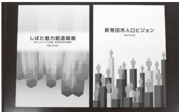
新発田市人口ビジョンと しばた魅力創造戦略

策とし、新年度は従来の行政運営から一歩踏み込んで、複数の施策間連携や広域間連携等により、課題解決に取り組み、施策を進めていく。旧態依然というのであれば、職員もまだまだ努力が足りないのかもしれない。叱咤激励と捉え、前例踏襲や横並び意識といった旧態依然の体制から脱却し、「新生しばた」をつくりあげるにふさわしい職員になつてもらいたい。