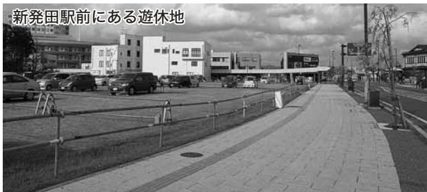
新発田駅前にある遊休地

答え ①当市の津波災害や原子力災害の計画は、県の計画との整合性を図るため、県計画の見直し結果を踏まえ進めたい。②市内の空間放射線の住宅地域での測定結果は、各自治会長に送付するとともに、ホームページや環境衛生課で閲覧できる。今後は公共施設など特定の箇所での測定を行いたい。PM2.5の測定は、外ヶ輪公園内の県大気測定局で行っており、結果は県・市のホームページで公表している。今後は国の指針に基づき国や県と一体となり取り組みたい。③市管理の橋梁は、重要度・緊急度等から総合的に判断し順次、改修や修繕に取り組む。市道舗装は、まずは調査を実施し、その結果をもとに順次改修に取り組むことで、予防保全型の対応により、長寿命化、維持管理費の削減にもつながる。管理者が不明の橋梁は、今後調査が必要であるが、まずは、利用度の高い市道橋を優先し対策を講じたい。④国益を守る義務を放棄し、参加国の言いなりのままにTPPに参加することに対しては断じて反対である。⑤商工会議所の駅前への移転について、商工会議所、NPO法人新発田まちづくりステーションの3者協議を加速させ、意見の一致を見出し、次のステップとして土地所有者である市と民間2者による合意を形成していくことになる。