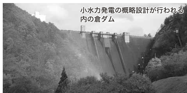
小水力発電の概略設計が行われる内の倉ダム

答 ①小水力発電については、平成25年度に、内の倉ダム維持放流口と加治川第一頭首工左岸幹線水路の2か所の概略設計を行い、平成26年度の採択と事業着手を目指す。②新エネルギー推進協議会で