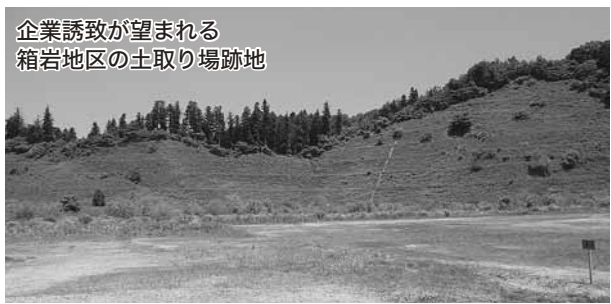
企業誘致が望まれる 箱岩地区の土取り場跡地

振興については、まちづくり総合計画の6つの施策をなお一層連携させ、総合的に推し進めることにより、市の経済成長を図りたい。新発田の経済成長を促していくためには、豊かな大地から生まれる地場産農産物の6次産業化をはじめ、観光振興による交流人口の増加や企業誘致による税収の確保と雇用の拡大、少子化対策による定住人口増加に向けた取り組みが重要である。「産業振興」と「少子化対策」を2本の柱に据え、体系的な連携を図り、総合的に推し進めていくことで、今後の自治体間、地域間競争を勝ち抜いていき、地域経済の成長が