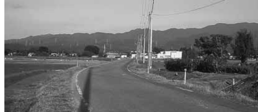
歩道整備が予定されている五十公野岩井戸石喜線

Q 安全なまちづくり、通学路の安全対策について A 通学路の危険箇所について、県市警察、学校及びPTA等との合同点検で情報の共有を図った 問 通学路の安全対策について、①国の「防災安全交付金」を活用した整備計画はあるのか。②連絡協議会を設け、デジタルデータ管理で情報収集の一元化をし、団体の連携による推進体制の強化の必要性を伺う。 答 ①今年度、関係者合同で通学路百十か所の点検を行った。今回の調査で危険箇所として挙げられた西新発田五十公野線の東豊小学校脇の道路の改修を現在進めている。 問 平成25年度は、七葉小学校裏の七葉小館野小路線の拡幅整備、JA北越後川東支店裏の五十公野岩井戸石喜線の歩道整備を予定している。②市内全小中学校を対象に、危険箇所について調査した。教育委員会、地域安全課、新発田警察署、地域整備課、県地域振興局、学校及びPTA関係等による合同点検を実施し、情報の共有を図った。情報のデジタル化は、GIS地図情報システムの活用など、今後の課題と認識している。