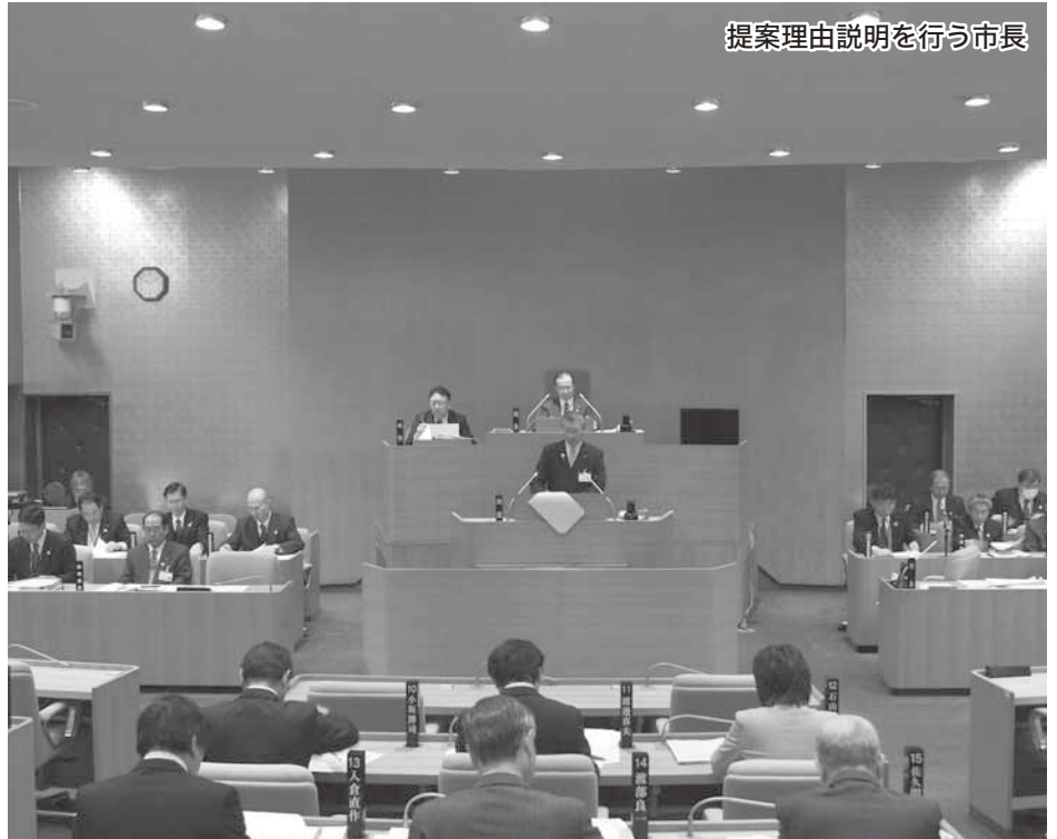
提案理由説明を行う市長

平成25年2月定例会は2月27日から3月26日までの28日間を会期として開かれました。定例会では、平成25年度当初予算案などの予算議案や条例改正案などの一般議案、副市長の選任及び教育委員会委員の任命などの人事議案などが慎重に審議されました。また、会派代表質問や一般質問で市長の政治姿勢など、市政をたどりました。