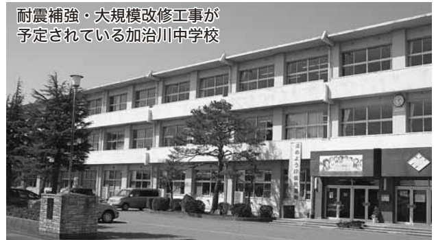
耐震補強・大規模改修工事が 予定されている加治川中学校

答え 国では、長引くデフレの悪循環から脱却し、強い経済を取り戻すため、大規模な経済対策を打ち出した。当市も、この機を逃がすことなく、地域経済にいち早く投資効果が生まれ、波及するよう、学校施設の耐震化や街路整備など積極的に前倒しし、平成25年度予算と一体的なものとして編成した。将来にわたる健全財政も見据えながら、市民生活を支え、新発田市のまちに元気を取り戻すため、今できる精一杯の予算を組み、積極型予算とした。