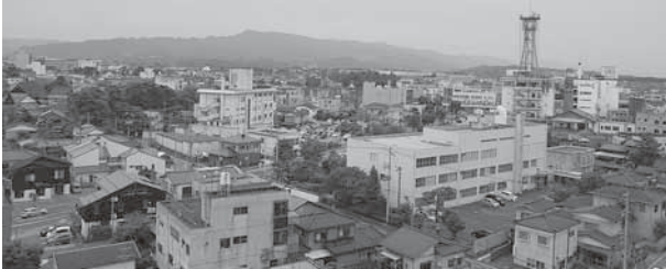
人口約10万人の新発田市

問 広域合併により10万人都市を達成した新発田であるが、少子高齢化による人口減少が深刻度を増している。市長の掲げる「交流人口の増加による「地域経済の活性化」をダイナミックに実施し、人口を維持でなく「増やす」夢を語ってはどうか。