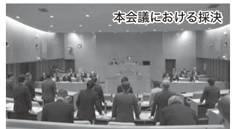
本会議における採決