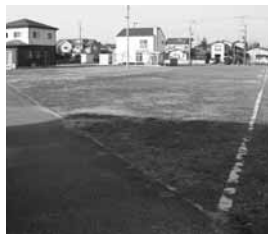
旧中曽根市営住宅跡地

A 面積は、34,688㎡、平成25年度の歳入予算は7,400万円を計上している。売却場所は、平成24年度、旧中曽根市営住宅跡地を12区画売却したうち残り6区画、旧新井田第2団地、旧加治保育園等も順次平成25年度に売却していきたい。