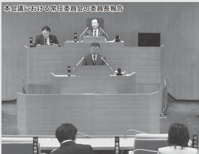
本会議における常任委員会の委員長報告

一般議案や補正予算議案は、常任委員会に付託され、慎重に審議されます。 その審議の経過と結果は、本会議で各常任委員長が報告し、質疑、討論を経て採決されます。